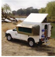
Trax Toyota 4x4 o simile 2 passeggeri 1 letto doppio nel veicolo