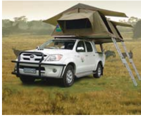
Safari Toyota 4x4 o simile 2/4 passeggeri 2 tende sul tetto