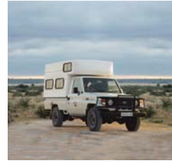
Bushcamper 2 passeggeri 1 letto doppio nel veicolo