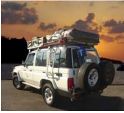
Nomad Land Rover 2/4 passeggeri